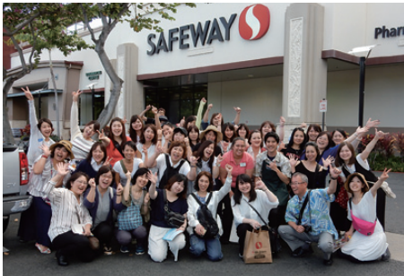
みんなパワー全開でシャカピース!