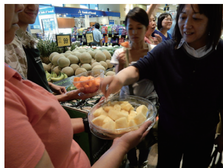
セーフウェイではローカルのフルーツを試食。