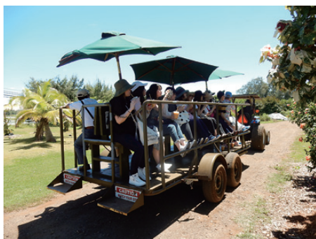
トラクターに引かれて、オーガニック農場を1周。

ハワイの小売サービス業の視察を通じて、アメリカ小売業の楽しさ、便利さ、ありがたさを実体験していただく海外視察ビギナーのための視察研修会です。アメリカ小売業の全体像から、視察の仕方、店舗の見方、ストアコンパリゾンの方法まで結城義晴がわかりやすく解説します。世界で一番、ドキドキ・ワクワクできる場所、ハワイで学ぶ、充実の5日間をお約束します。