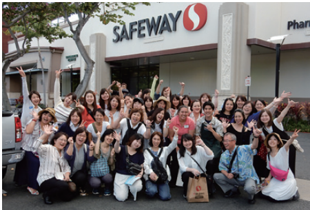
みんなパワー全開でシャカピース!