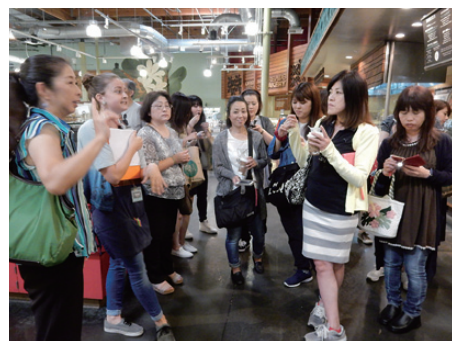
ホールフーズのインタビューと店内ツアー。