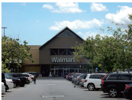
最初に向かうのは、世界最大のウォルマート。