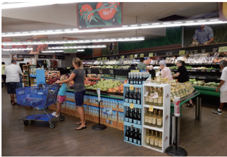
ドン・キホーテ傘下のタイムズ・スーパーマーケット。